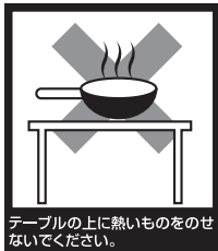
テーブルの上に熱いものをのせないでください。