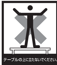
テーブルの上立たないでください。