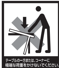
テーブルの一方または、コーナーに極端な荷重をかけないでください。