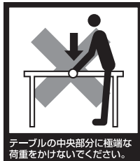
テーブルの中央部分に極端な荷重をかけないでください。